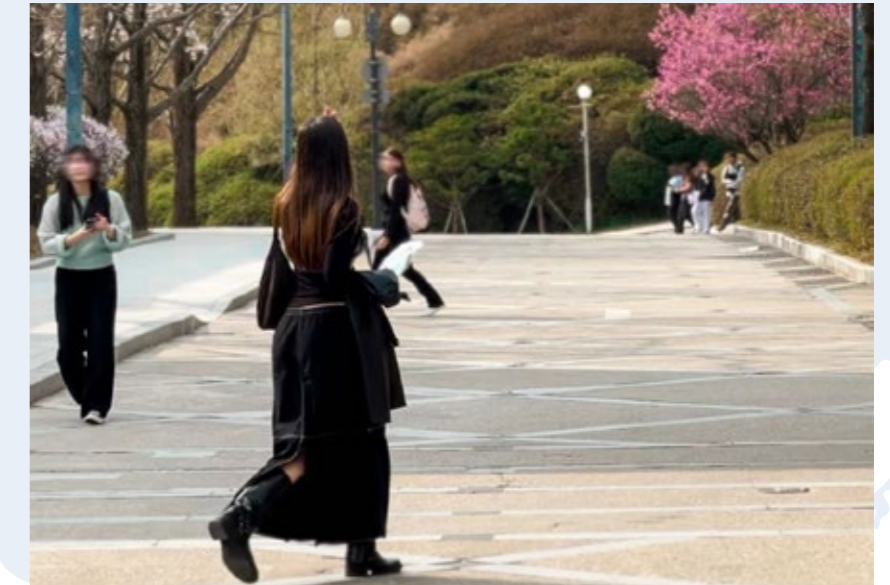
Ayla, estudiante de 3º en Seúl, Corea del Sur